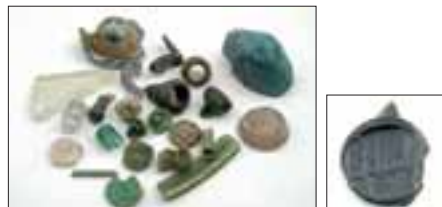
Funde von der Bristower Glashütte