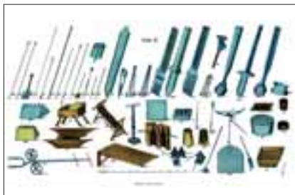
Diverse Glasmacherwerkzeuge aus: Die Praxis der Hohlglas-Fabrikation (Reprint der Ausgabe Berlin 1867)

Zur Herstellung der verschiedenen Glaswaren wurden die unterschiedlichsten Werkzeuge benötigt. Das wohl wichtigste Werkzeug war die Glasmacherpeife. Hierbei handelte es sich um ein langes dünnes Metallrohr, das an einem Ende mit einem