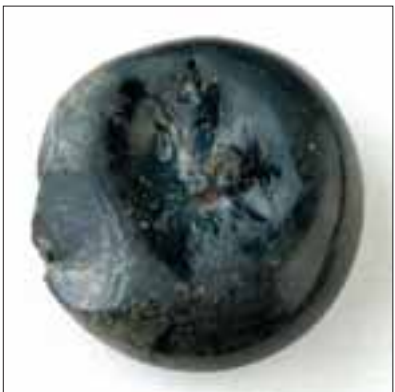
Der Gnielstein, eigentlich ein Abfallprodukt, wurde zum Glätten von Nähten benutzt, konnte aber auch zum Zermahlen von Salz und Gewürzen genommen werden.