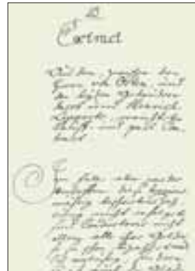
Hüttenvertrag der Glashütte Görzhausen

Im Vertrag wurden das Hüttenrevier und die Holznutzung fixiert. In der Regel durfte alles Holz genutzt werden, außer alten Eichen, Obstbäumen und jungen Buchen. Die Dauer des Hüttenbetriebes und die Anzahl der Brennwochen pro Jahr (meist zwischen 36 und 43 Wochen) wurden geregelt. Letztendlich wurden die finanziellen Verbindlichkeiten für den Aufkauf des Holzes und unentgeltliche Nutzungen, wie Viehweide, Gartenland und Gebäude, festgelegt. Die Zahlungen waren in mehreren Jahresraten zu Trinitatis üblich. Der Hüttenmeister sicherte sich oft Privilegien. So durfte er sich beispielsweise einen höheren Schweinebestand für die Waldmast halten als die Hüttenarbeiter. Die Höhe des Viehbestandes war ebenfalls genau geregelt, ebenso die Zahlung von Steuern und anderen Abgaben.