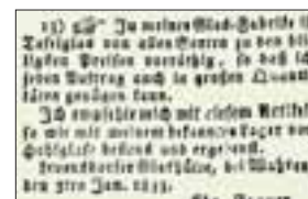
Anzeige aus dem Mecklenburgisch-Schwerinschen Anzeiger vom 09.01.1833

Aus Quarzsand und Holzasche wurden Glaserzeugnisse aller Art hergestellt. Durch Zugabe von Mineralien konnte Einfluss auf die Farbe genommen werden. Vorwiegend wurde jedoch das typische grün-bräunliche bis schwarz-grüne Waldglas hergestellt, das seine Farbe durch das im Sand enthaltene Eisenoxyd erhielt. Man war aber auch in der Lage, durch Verwendung von Glasseife weißes Glas zu produzieren.