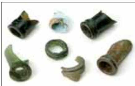
Bei den Flaschenhalsen wurde ein Glasfaden um die Öffnung gelegt. So konnte man später einen in die Öffnung getriebenen Holzkorken mit einem Bindfaden befestigen, ohne dass dieser abrutschte.