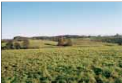
Durch Rodung gewonnenes Weideland – Landschaft bei Görzhausen