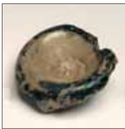
Bei diesem Flaschenboden ist deutlich die Patina erkennbar, die sich durch Korrosion, bedingt durch das lange Liegen im Erdboden, gebildet hat.