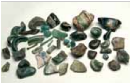
Funde von der Neuen Hütte Marxhagen – neben Scherben findet man vorwiegend Gastropfen und Absprünge auf der Hüttenstelle.