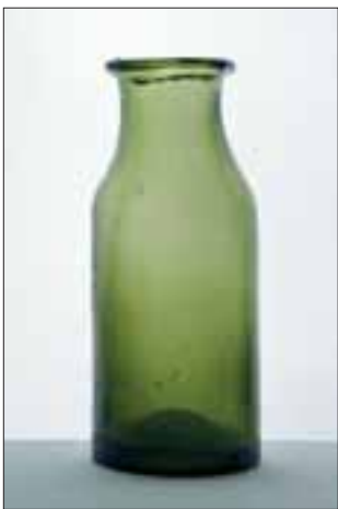
Konservengläser verschloss man ähnlich wie Flaschen durch Zubinden der Öffnung. Daher war ein breiter Rand notwendig.