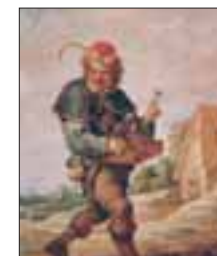
Der Schnapshändler