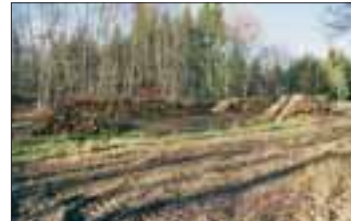
72 Raummeter Holz – Brennholzvorrat für 6 Tage

Während des Betriebes einer Glashütte fand im näheren Umfeld ein bedeutender Holzeinschlag statt. Der jährliche Verbrauch einer Hütte lag bei ca. 1000 Faden Holz, was in etwa 3.500