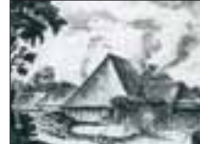
Glashütte aus dem 18. Jahrhundert

Vielleicht hat der eine oder andere noch ein Gefäß aus Waldglas, wie das grüne oder schwärzliche Glas aus mecklenburgischer Produktion genannt wird. Er hat damit etwas besonderes in seinem Besitz, nämlich – ein Stückchen Mecklenburg.